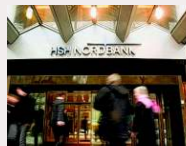
Die Fassade der HSH.

beschäftigt werden – noch am gleichen Tag wurde er fristlos gefeuert. Heute ist klar: Der Mann ist Opfer einer Intrige geworden. Eineinhalb Jahre nach der Entlassung schiebt die HSH nun eine kleinlauten Erklärung nach. Wegen der unberechtigten Entlassung und der massiven Rufschädigung erhielt er eine millionenschwere Abfindung. Die Verfehlungen lagen nicht bei dem Manager, sondern bei der Bank, die zu einem großen Teil den Ländern Hamburg und Schleswig-Holstein gehört. Wer dafür erst einmal haftet, ist klar: der Steuerzahler. KÖ