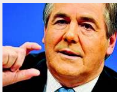
KÖ Bankchef Ackermann.

verklagten sie das Institut, weil sie sich schlecht beraten und über die Risiken nicht aufgeklärt sahen. Nach einem aufsehenerregenden Urteil des Bundesgerichtshofs sehen sie ihre Position nun entscheidend gestärkt. Einem hessischen Unternehmen, das die Bank verklagt hatte, sprachen die Richter in einem Musterverfahren einen Schadenersatz von 540 000 Euro zu. Nun rechnen auch die Kommunen damit, ihr Geld zurückzubekommen – und ziehen daraus hoffentlich die Lehre, dass eine Stadtkämmerei keine Zockerbude ist.